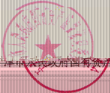
天津市人民政府国有资产监督管理委员会