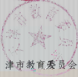
天津市教育委员会