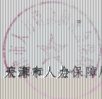
天津市人力资源和社会保障局