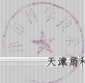
天津市科学技术局